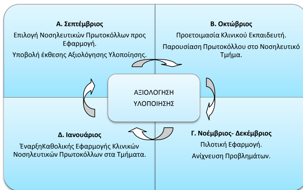
Σχηματική Αναπαράσταση Χρονοδιαγράμματος

Επίσης, κάθε επόμενο έτος αφορά την αξιολόγηση των τίτλων που ήδη εφαρμόζονται και αυτούς που επιλέχθηκαν να χρησιμοποιηθούν για τον επόμενο χρόνο.