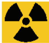
Σχήμα 4 - Διεθνές σύμβολο βιολογικού και ραδιενεργού χαρακτήρα

Τα κατάλληλα αποθηκευτικά μέσα θα πρέπει να είναι διαθέσιμα στα αντίστοιχα σημεία παραγωγής των αποβλήτων. Ειδικές οδηγίες που αφορούν την κατηγοριοποίηση, διαλογή και πλήρωση των αποθηκευτικών μέσων θα πρέπει να είναι αναρτημένες σε όλα τα σημεία παραγωγής και συλλογής των αποβλήτων.